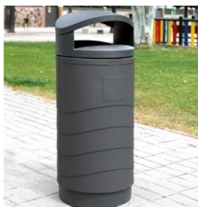
DETALLE PAPELERA MODELO MILENIUM 80 L DE CONTENUR

Se colocarán 12 de papeleras modelo MILENIUM 80 L de CONTENUR, repartidas en ambas márgenes.